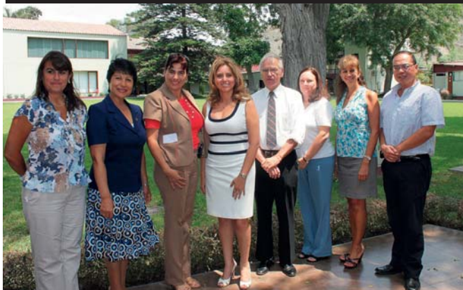
Taller ecoeficiencia pedagógica en un descanso durante la primera conferencia sobre eficacia en la gestión pedagógica, dirigida a directores de colegios.