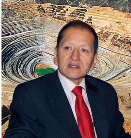
Jorge Merino, ministro de Energía y Minas conversa con Informesan.

hasta el empresario industrial, pasando por el taxista, etc.; debemos transmitir a todos los peruanos que tenemos mucho gas. Desde el ministerio queremos promover la formación de más técnicos en gas que puedan trabajar en las instalaciones domésticas. Pero si bien hay que trabajar más con este recurso, tampoco debemos descuidar los otros retos: cambiar la matriz energética y construir más centrales hidroeléctricas, por ejemplo. Yo estoy proponiendo un paquete que consta de tres servicios para las zonas rurales: energía eléctrica, cocinas mejoradas a gas e Internet. Esa es la cara social del sector, en la que estoy incidiendo mucho.