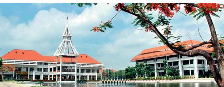
Campus de Thammasat University, Bangkok.