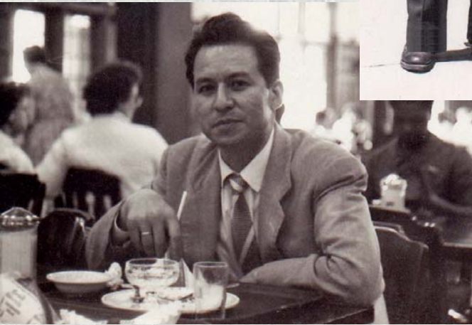
En Cornell University, en una de sus visitas después de optar el grado de doctor en Antropología.