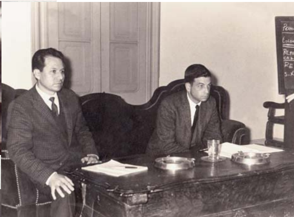
En 1970, en Lima, como jurado calificador.