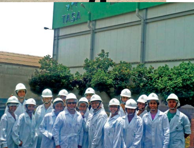
Grupo de alumnos de pregrado durante su visita a TASA.