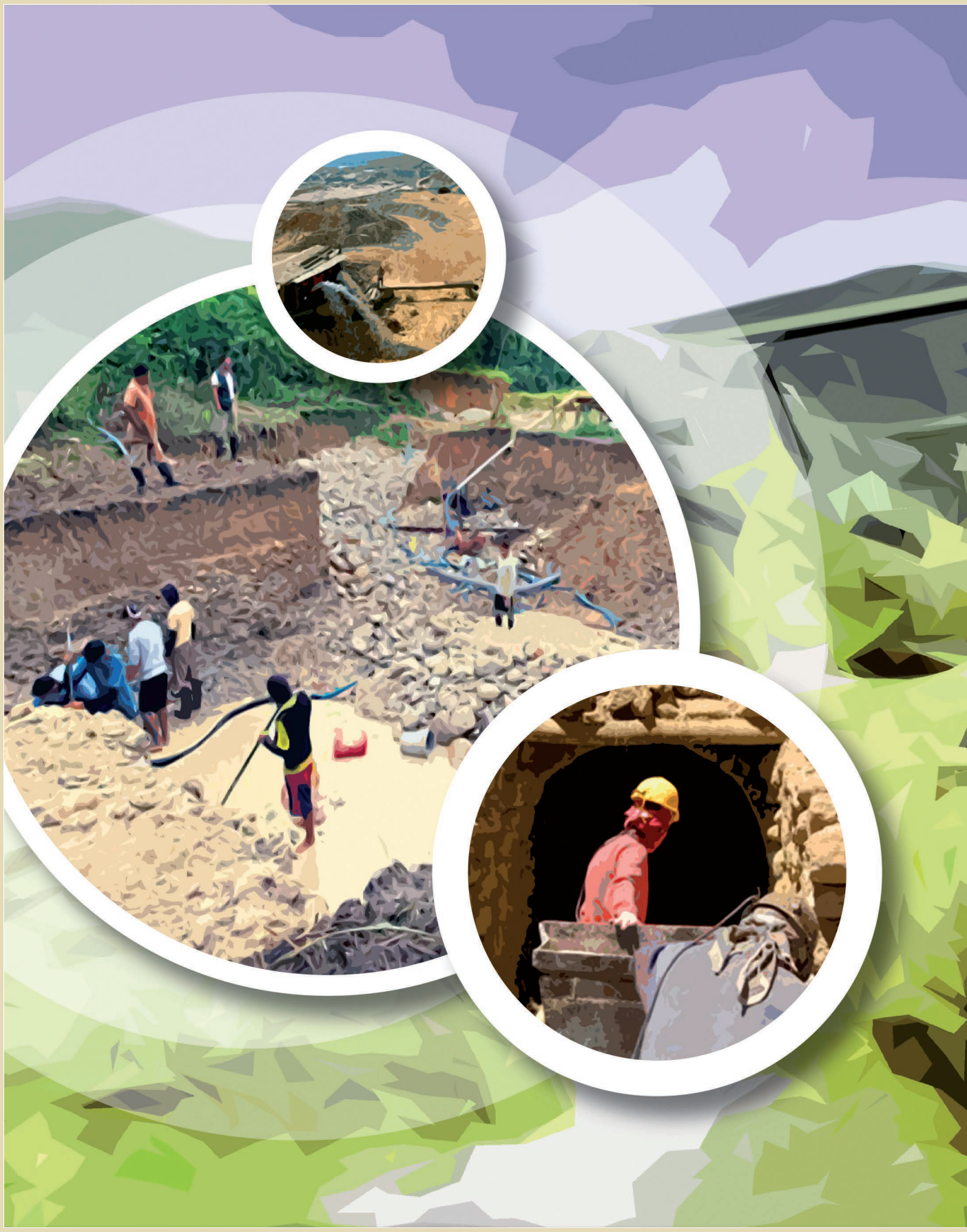
Collage: E. Ch.