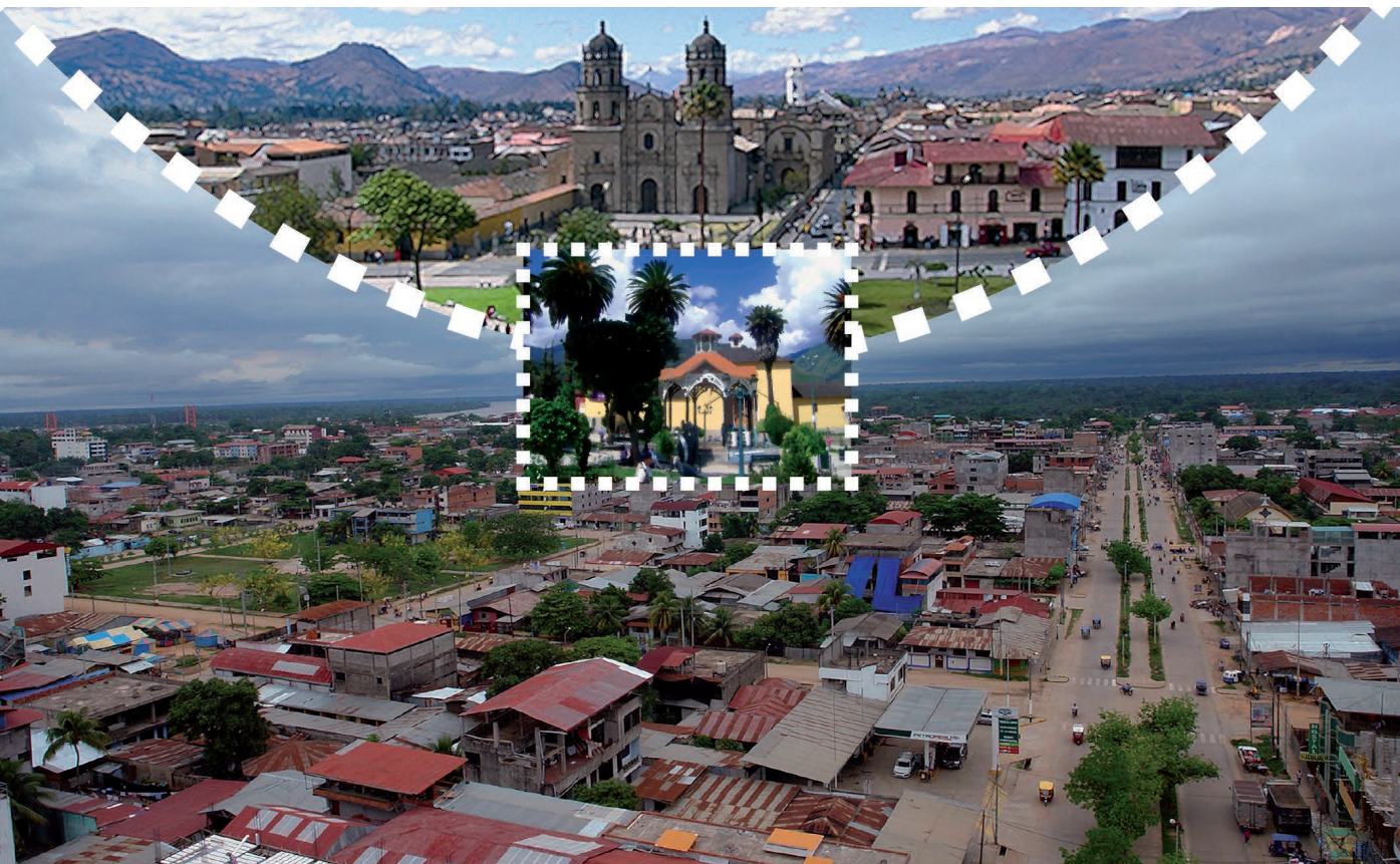
Collage: E. Ch.

47.5% de la población vive en alguna de las veinticuatro ciudades más habitadas (Lima Metropolitana es la mayor concentración urbana: alberga al 30% de todos los habitantes). De las veinticuatro ciudades más importantes, diez tuvieron o tienen como principal actividad económica la extracción de materia prima; es decir, casi la mitad de ciudades peruanas se originaron en la aglomeración de personas atraídas por las actividades mineras o extractivas. Especial mención merece Huancavelica, quizá la primera ciudad minera del país: «Los colonos españoles que asomaban como empresarios mineros demasiado prósperos, como Amador de Cabrera, crearon yacimientos mineros claves, como los de Huancavelica» (Contreras, 2002).